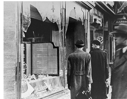
Noite dos Cristais Rotos (1938)