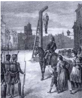
Execución Riego na Praza da Cebada (1823)

3. Identifica estes feitos históricos e coloca o ano no que teñan sucedido: