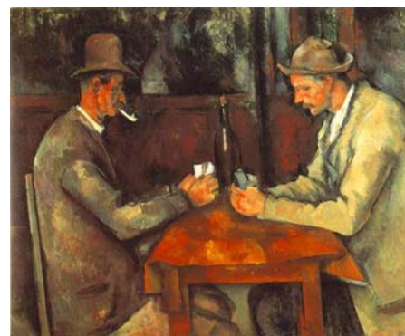
Os xogadores de cartas (Cezanne)