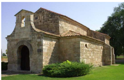
San Juan de Baños