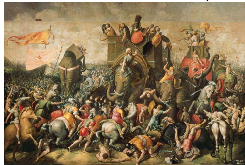
Batalla Zama (202 a. C.)