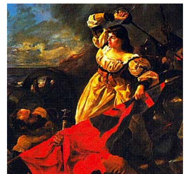
María Pita defende A Coruña