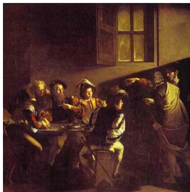
A Vocación de S. Mateo