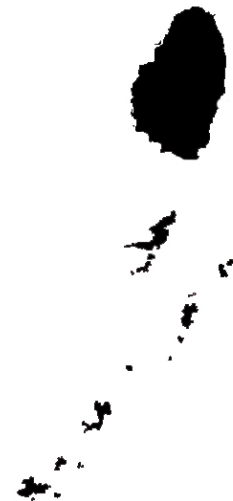
San Vicente y las Granadinas