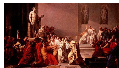
Asasinato de César