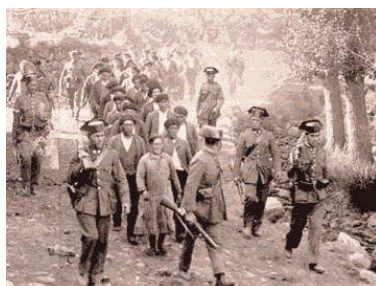
Revolución de Asturias