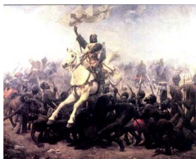
Batalla de las Navas de Tolosa