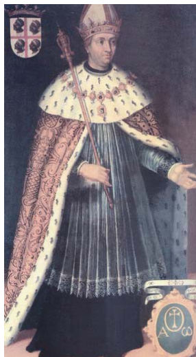
Ramiro II Aragón