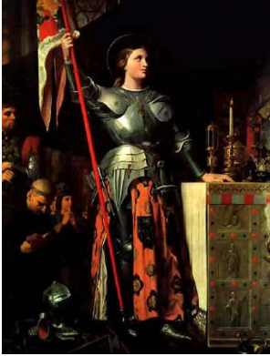
Juana de Arco