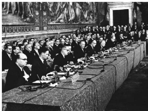
Tratado de Roma