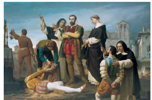
Execución líderes comuneros