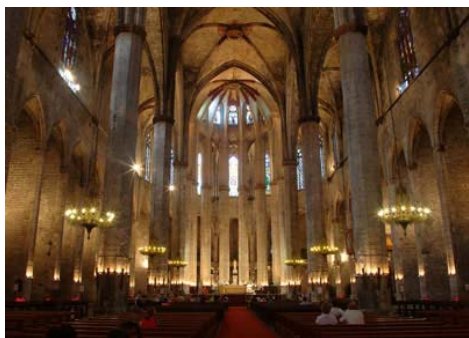
Santa María do Mar