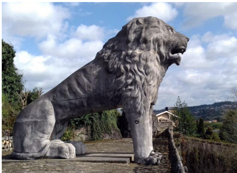
Parque do Pasamento (Betanzos)