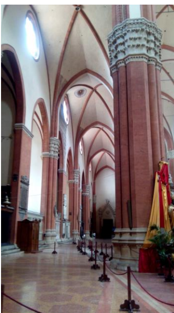
San Petronio (Bologna)

2. Nome e lugar da enorme igrexa italiana e lugar de Galicia onde se atopa a escultura.