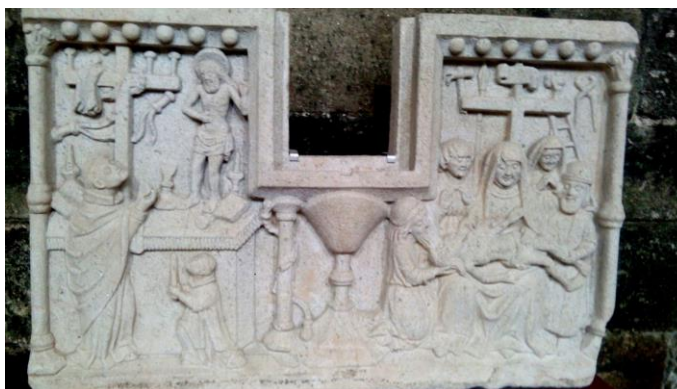
Vilar de Donas (Palas de Rei)