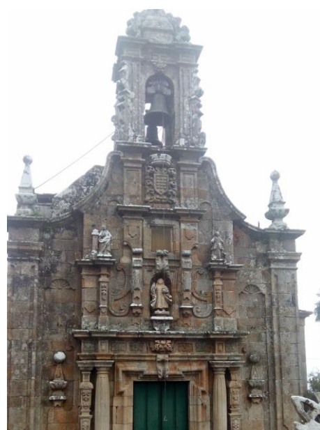
Igrexa de Berán (Leiro, Ourense)