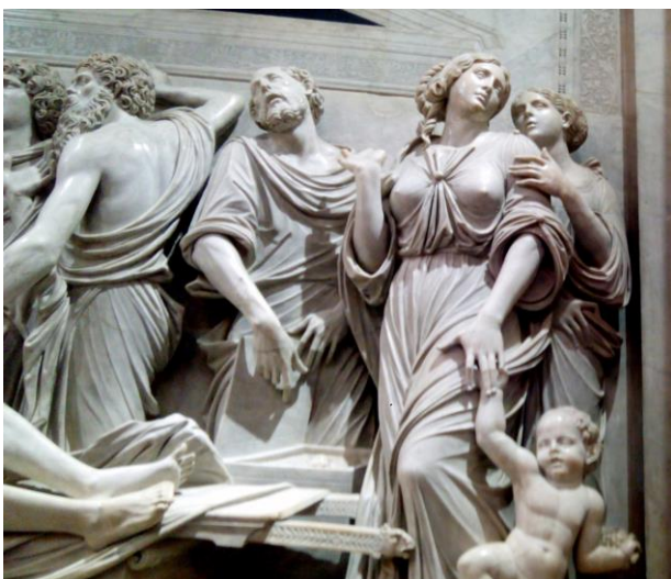
Tumba de San Antonio (Padua).